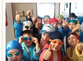
Attività di nuoto