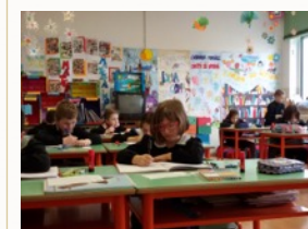
Attività curriculari e laboratoriali.