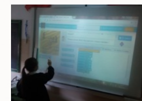
LIM o videoproiettori in ogni classe per lo sviluppo delle competenze digitali