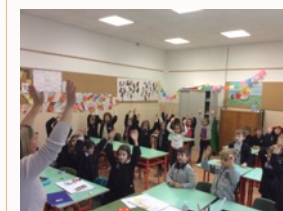
Musica e canto corale