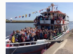
Visite didattiche che restano nella mente e nel cuore.